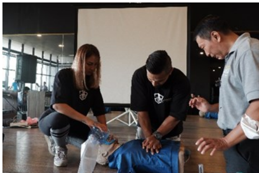
Gambar 2. Praktek P3K

petugas kesehatan, jika tanda vital ditemukan normal, dilanjutkan dengan penanganan P3K olahraga dengan metode Protection, Rest, Ice, Compression, Elevation (PRICE).