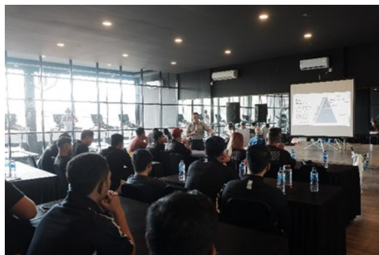
Gambar 1. Penyampaian materi