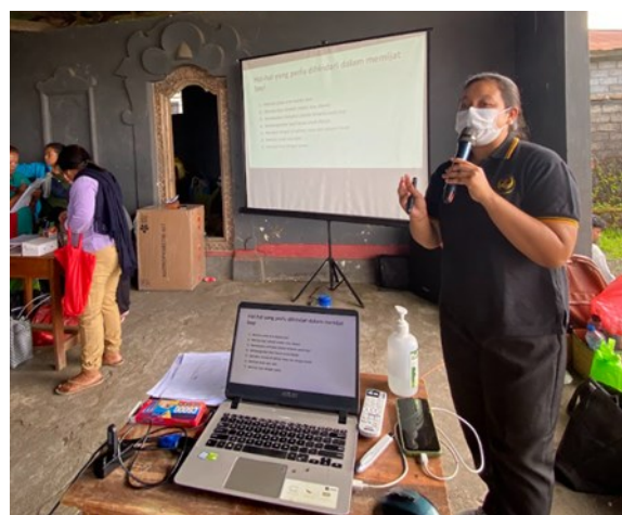
Gambar 2. Penyampaian materi baby gym

Materi ini diberikan untuk memberikan wawasan dan pemahaman bagi mitra mengenai stimulasi anak sesuai usia. Di samping itu, juga dikenalkan mengenai baby gym meliputi definisi, manfaat penting baby gym untuk bayi dan orang tua dan langkah-langkah baby gym .