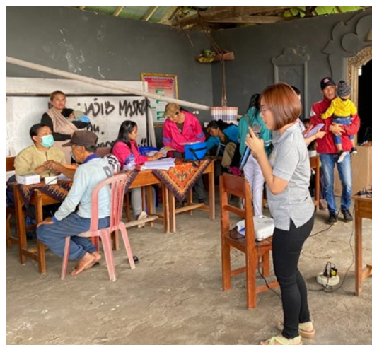
Gambar 1. Edukasi mengenai tumbuh kembang

Edukasi dilakukan kepada mitra dengan topik pertumbuhan dan perkembangan anak serta edukasi mengenai gangguan dan dampak pada gangguan perkembangan.