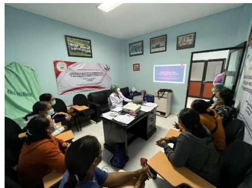
Gambar 4. Pemberian Materi Cairan