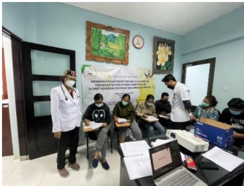
Gambar 3. Pretest-posttest Cairan

Berikut adalah gambar bersama dengan mitra pada saat kegiatan PKM, leaflet yang dibagikan kepada mitra dan rerata hasil capaian program PKM.