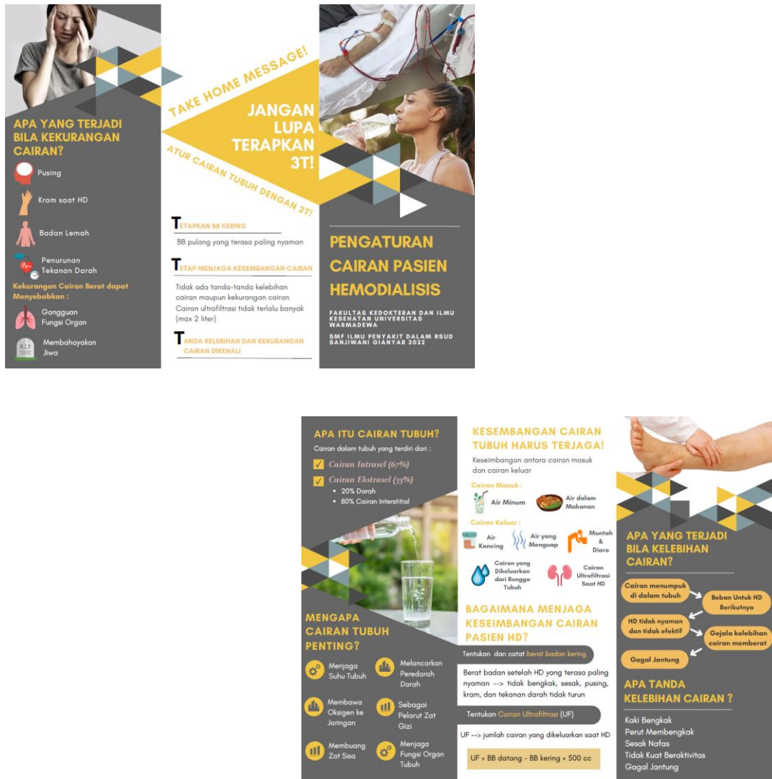
Gambar 5. Pamflet Cairan