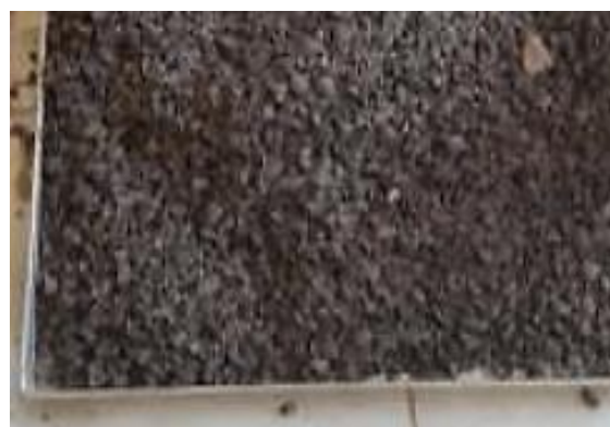
Gambar 1. Cangkang kelapa sawit

Bahan penelitian berupa semen Portland type I (semen Gresik) berdasarkan SNI 2847-2002. Pasir pawan berasal dari Sungai Pawan, batu pecah milik CV. Mega Sari di Sukabangun, dan air. Alat yang diperlukan berupa: satu set saringan, timbangan, picnometer, tabung silinder, botol Le Chatelier , oven, cetakan beton, kerucut Abrams, mesin uji kuat tekan beton, sendok spesi, skop, penggaris, naman, dan tongkat pemadat.