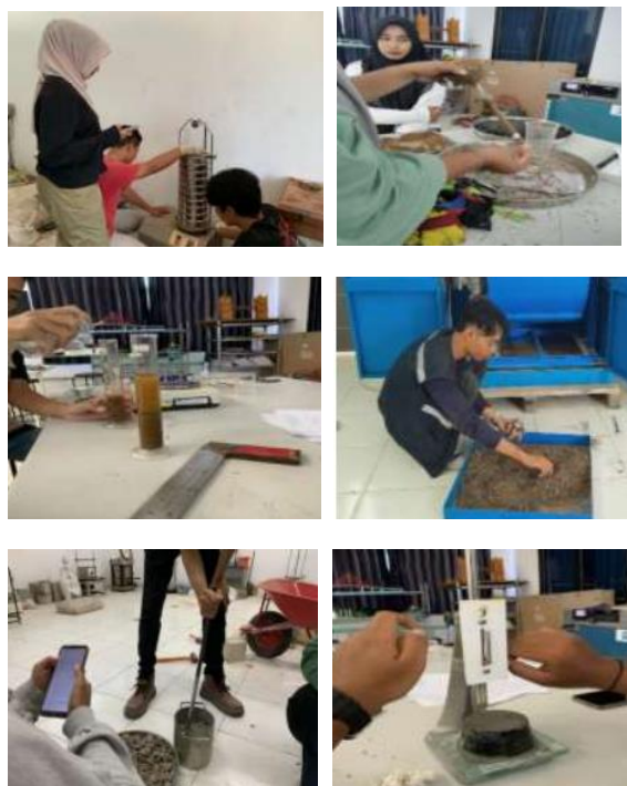
Gambar 2. Pengujian agregat berupa analisa saringan, berat jenis, kadar lumpur, keausan, berat isi, dan semen

Adapun tahapan penelitian yaitu (Gambar 2 dan Gambar 3): 1) pengujian material berupa pasir (pengujian analisa saringan, kadar air, kadar lumpur, berat isi, berat jenis dan penyerapan), batu (pengujian analisa saringan, kadar air, kadar lumpur, berat isi, berat jenis dan penyerapan), semen berupa pengujian vicat dan limbah cangkang kelapa sawit (pengujian kadar air, berat isi, berat jenis dan penyerapan); 2) melakukan perencanaan mix design ; 3) melakukan pembuatan dan perawatan beton; 4) pengujian kuat tekan beton; 5) analisa pengaruh cangkang kelapa sawit sebagai tambah agregat kasar terhadap kuat tekan.