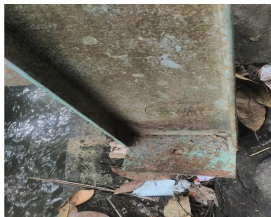
Gambar 3. Tumpuan pada pondasi yang telah terlepas

Perhitungan struktur rangka menggunakan program ETABS dengan memperhatikan dan menyesuaikan dengan struktur yang telah dibangun di lapangan dan memperkirakan beban-beban yang