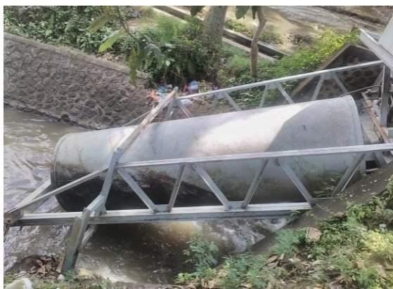
Gambar 2. Turbin pembangkit listrik tenaga mikro hidro di Tangeb

Untuk melakukan perencanaan perbaikan pembangkit listrik tenaga mikro hidro di Tangeb, untuk mengetahui potensi listrik yang dapat dibangkitkan perlu dilakukan perlu dilakukan penelitian mengenai kecepatan air (v), ketinggian muka air dan debit aliran (Q).