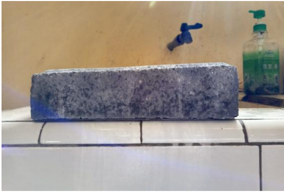
Gambar 3. Tinggi Paving Block Tidak Rata