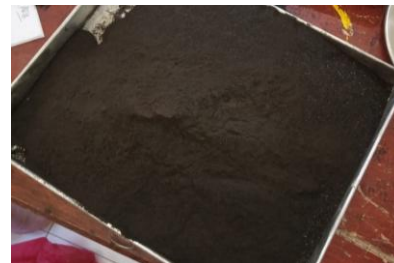
(d) Limbah abu daun bambu