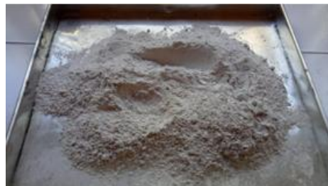
(e) Limbah serbuk kaca