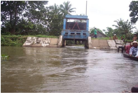
Gambar 1. Pintu Tanggul yang Terbuka di Polder Alabio

saluran drainase semakin mengecil karena adanya sedimentasi. Akibatnya air akan tergenang pada satu daerah dan pencucian air berupa proses keluar masuk air tidak berjalan dengan baik. Jika terus dibiarkan maka akan berakibat pada memburuknya kualitas air rawa pada daerah studi. Gambar 1 dan Gambar 2 menyajikan kondisi Polder Alabio.