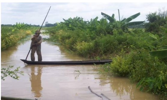
Gambar 2. Sedimentasi pada Saluran Irigasi di Polder Alabio

Polder Alabio merupakan salah satu pengembangan sistem polder tertua dan menjadi kebanggaan pengembangan lahan rawa lebak di Indonesia terutama Propinsi