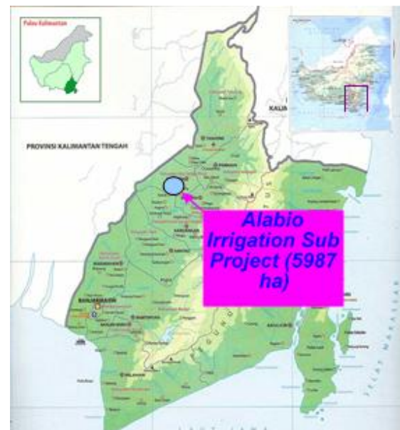
Gambar 4. Daerah Studi Polder Alabio di Kabupaten Hulu Sungai Utara, Kalimantan Selatan

Lokasi studi berada pada Kecamatan Danau Panggang, Sungai Pandan dan Babirik Kabupaten Hulu Sungai Utara Provinsi Kalimantan Selatan. Lebih tepatnya berada di daerah Alabio yang sekarang bernama Kecamatan Sungai Pandan, Kalimantan Selatan. Lokasi wilayah studi yaitu Polder Alabio ditunjukkan pada Gambar 4.