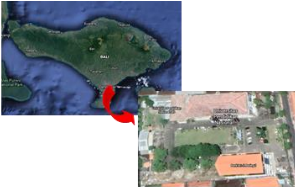
Gambar 1. Peta Lokasi Studi