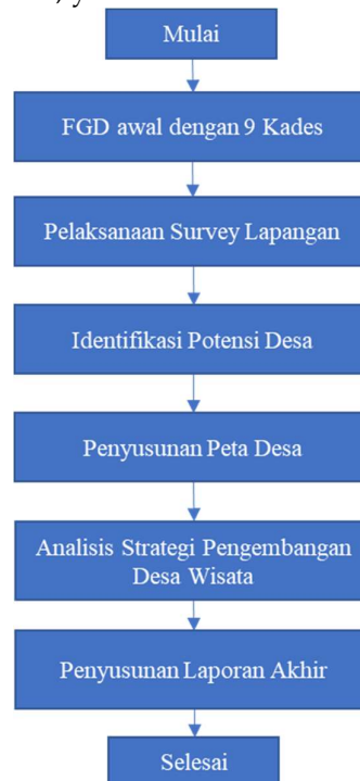
Gambar 1. Langkah pelaksanaan program

Metode pelaksanaan program pendampingan ini adalah langkah-langkah dalam pelaksanaan solusi dan target capaian, yaitu: