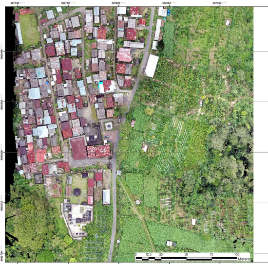
Gambar 2. Sample hasil orthomosaic Desa Pengejaran

Penerbangan drone direncanakan untuk mampu mencakup area desa dengan ketinggian rerata 30-50m. Hasil pengambilan foto dengan UAV selanjutnya dilakukan koreksi radiometrik dan geometris untuk menyesuaikan bentuk foto. Beberapa faktor eksternal, seperti efek atmosfer (misalnya variabilitas spektral dari material permukaan, penyerapan, dan hamburan), menyebabkan degradasi citra spektral (Tu dkk., 2018). Pengolahan hasil foto dilakukan dengan software mapper Pix4D dan memvisualisasikan hasil pemetaan dengan ArcGIS. Orthomosaics yang diperoleh dari citra UAV dapat mencapai resolusi beberapa sentimeter (Nebiker dkk., 2008). Jumlah foto udara tiap desa tergantung pada luasan area yang disurvei. Proses orthomosaic foto UAV dengan PIX4D Mapper menghasilkan foto udara beresolusi tinggi dapat mengidentifikasi permukiman di Desa kajian. Berikut adalah sample hasil orthomosaic.