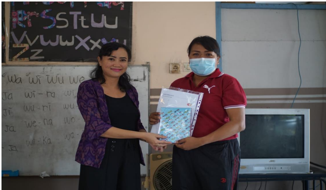
Penyerahan Bahan Ajar di TK Widya Kusuma Sari