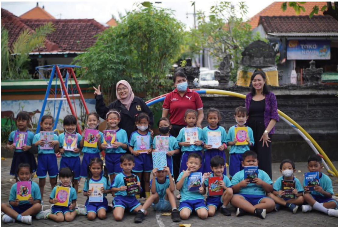
Dokumentasi Bersama Siswa TK Widya Kusuma Sari