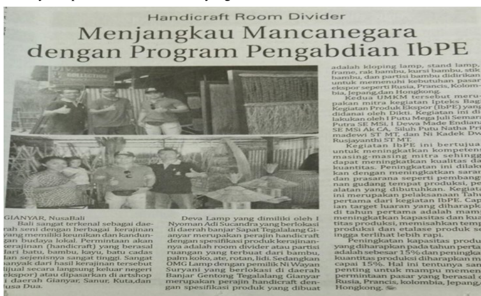
Gambar 4 Publikasi Pada Koran Nusa Bali