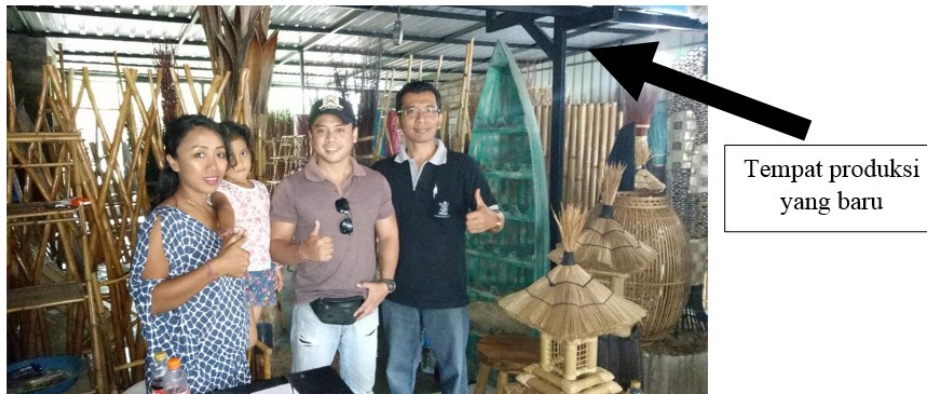
Gambar 3 Tempat produksi yang selesai dikerjakan