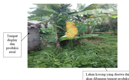
Gambar 1 Lahan Kosong yang disewa