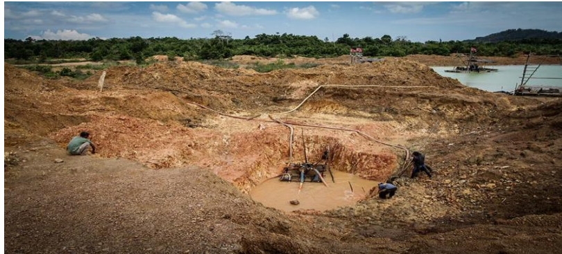
Gambar 1. Kondisi Fisik Lahan Pertambangan di Kecamatan Jebus

menyebutkan bahwa kondisi tanah yang tidak stabil membuat mereka hanya mengandalkan titik kerja yang dianggap kosong. Aparat desa mengakui bahwa mereka tidak memiliki data batas fisik yang rinci mengenai lokasi pertambangan rakyat.