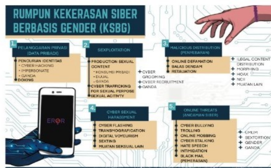
Gambar 3. Rumpun KBGO

Kelima rumpun ini memuat jenis kekerasan yang ditunjukkan pada gambar 3 berikut :