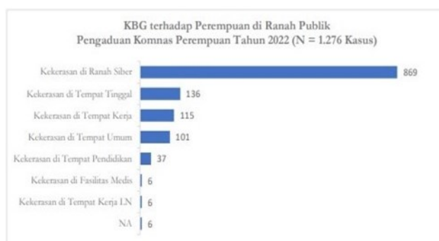
Gambar 2. KBG Terhadap Perempuan di Ranah Publik Berdasarkan Pengaduan Komnas Perempuan Tahun 2022

Kekerasan berbasis gender di ranah publik mengalami tren peningkatan, hal ini menandakan ruang umum tidaklah aman bagi perempuan. Pengaduan KBGO mengalami peningkatan sejak tahun 2019 hingga tahun 2022. Dengan meningkatnya jumlah pengaduan ke Komnas Perempuan, mengartikan bahwa korban sudah memiliki kesadaran untuk memperjuangkan hak-haknya, agar pelaku dapat diproses secara hukum agar tidak jatuh lagi korban lainnya.