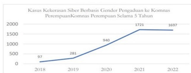
Gambar 1. Kasus KBGO Pengaduan ke Komnas Perempuan 2018-2022

Kekerasan berbasis gender di ranah publik mengalami tren peningkatan, hal ini menandakan ruang umum tidaklah aman bagi perempuan. Pengaduan KBGO mengalami peningkatan sejak tahun 2019 hingga tahun 2022. Dengan meningkatnya jumlah pengaduan ke Komnas Perempuan, mengartikan bahwa korban sudah memiliki kesadaran untuk memperjuangkan hak-haknya, agar pelaku dapat diproses secara hukum agar tidak jatuh lagi korban lainnya.