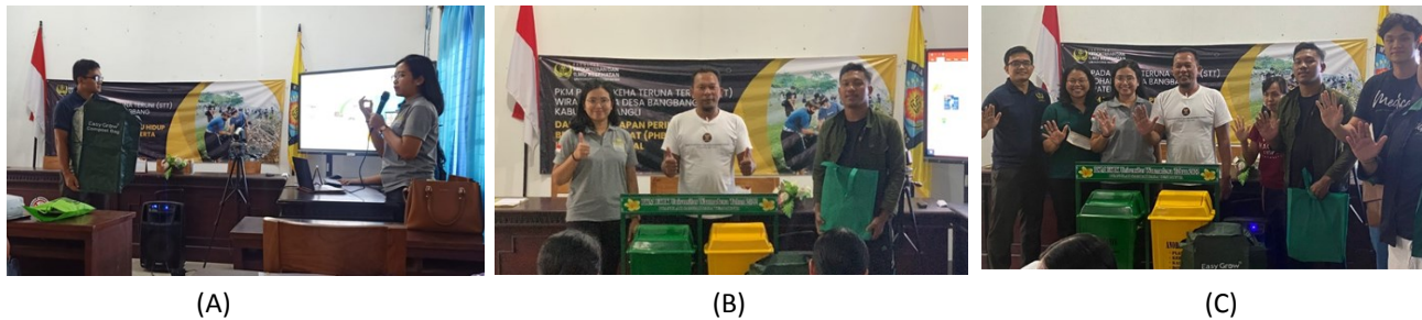
Gambar 1. Dokumentasi kegiatan PKMS. (a) Pemaparan materi; (b) Pemberian bantuan; dan (c) Foto bersama.

pemahaman mitra mengenai materi yang diberikan. Kegiatan diakhiri dengan pemberian bantuan. Dokumentasi kegiatan dapat dilihat pada Gambar 1 berikut.