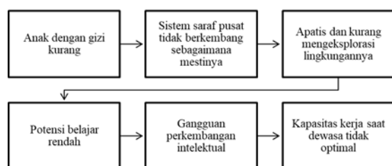
Gambar. 2 Mekanisme gizi kurang menyebabkan perkembangan kognitif tidak optimal 16,17,18 .

Penelitian menunjukkan adanya hubungan antara status gizi dan perkembangan kognitif yang bermakna ( p=0,000 ). Hal serupa juga disampaikan pada penelitian oleh Nyaradi (2015), dan Tandon et al (2016) dimana gizi baik dikaitkan dengan perkembangan kognitif anak yang baik 14,15 . Sebaliknya, anak dengan gizi kurang cenderung apatis, oleh karena kinerja sistem saraf pusat yang tidak optimal dalam menerima informasi atau rangsangan dari lingkungan 16 . Selain itu, anak dengan gizi kurang, akan berisiko mengalami penurunan konsentrasi, gangguan perkembangan intelektual, potensi belajar rendah, peningkatan risiko penyakit saat dewasa, dan kapasitas kerja yang buruk dikemudian hari 17 . Penelitian oleh Jimoh et al (2018) dengan sampel anak berusia 6-59 bulan melaporkan bahwa anak dengan gizi kurang tiga kali lipat berpotensi mengalami keterlambatan perkembangan bahasa dan pendengaran dibandingkan anak dengan gizi baik (OR 3,25, 95% CI 1,09-9,72)(18). Gizi kurang akan menyebabkan keterlambatan pematangan jalur pendengaran dan memengaruhi pendengaran pusat serta perifer sehingga anak mengalami kesulitan dengan bahasa lisan maupun tulisan 18 .